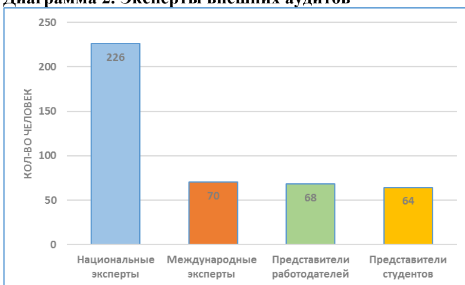
Диаграмма 2. Эксперты внешних аудитов

Международные и национальные эксперты привлекались исходя из компетенций и соответствующего образования. Таким образом, из 296 экспертов, участвовавших во внешнем аудите за 2016 год (не включая