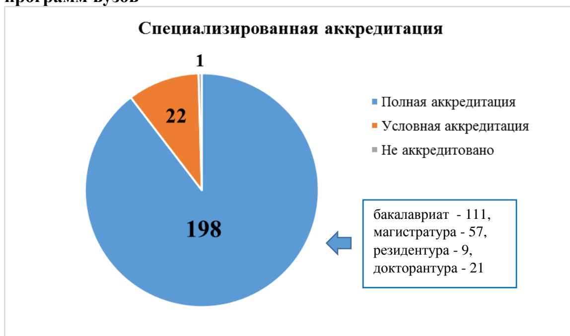
Диаграмма 4. Решения по аккредитации образовательных программ вузов

По результатам повторных внешних визитов Аккредитационным советом аккредитованы 6 образовательных программ, аккредитованные ранее с условием: