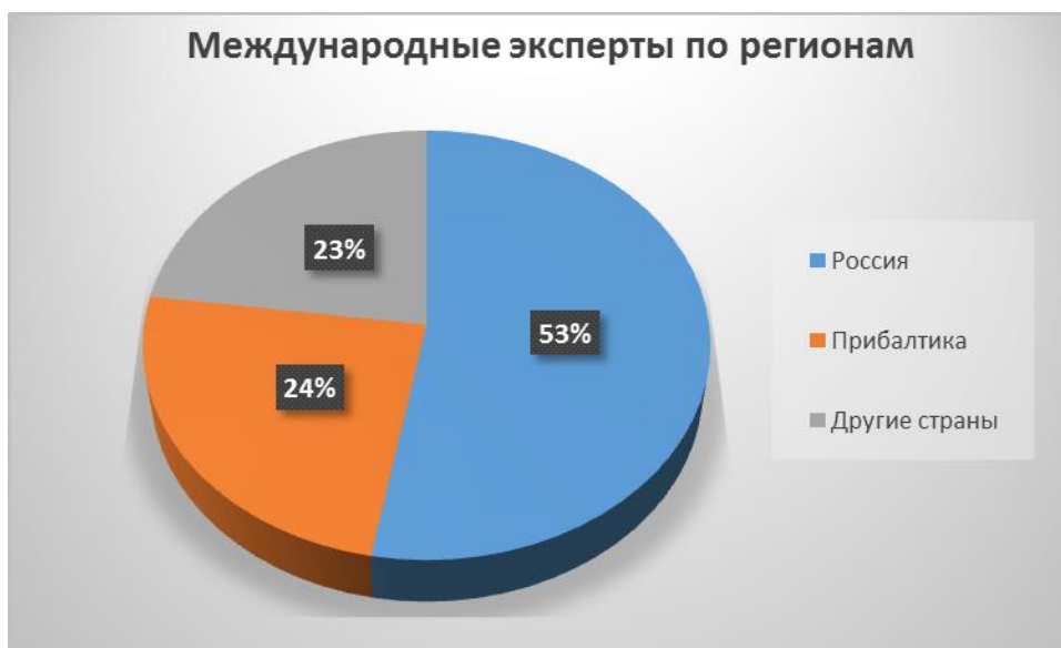
Диаграмма 1. Международные эксперты по регионам

В 2016 году в процедуре аккредитации вузов и НИИ участвовали национальные эксперты – 226 человек, представители работодателей – 68, представители студентов – 64.